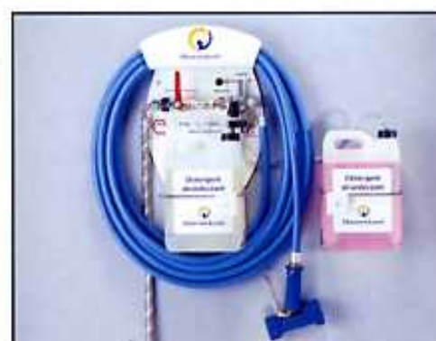
Kit double produit monté