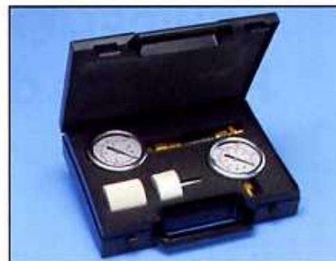
Kit de contrôle technique