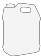
Jerrican plastique de 5l