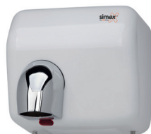
Ref. 01002 Finish: White Finition: Blanc Power: 2.300 W Puissance: 2.300 W