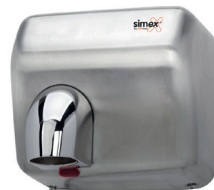
Ref. 01006 Finish: Satin Finition: Satiné Power: 2.300 W Puissance: 2.300 W