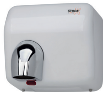
Ref. 01002 Finish: White Finition: Blanc Power: 2.300 W Puissance: 2.300 W