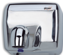
Ref. 01004 Finish: Polished Finition: Brillant Power: 2.300 W Puissance: 2.300 W