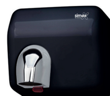
Ref. 01068 Finish: Black Finition: Noir Power: 2.300 W Puissance: 2.300 W