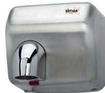
Ref. 01006 Finish: Satin Finition: Satiné Power: 2.300 W Puissance: 2.300 W