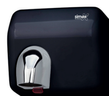
Ref. 01068 Finish: Black Finition: Noir Power: 2.300 W Puissance: 2.300 W