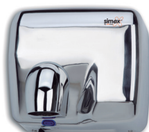
Ref. 01004 Finish: Polished Finition: Brillant Power: 2.300 W Puissance: 2.300 W