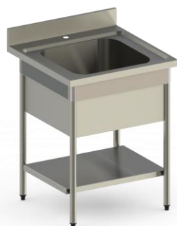
PP107 + EG707